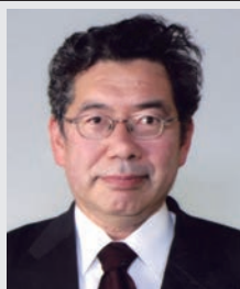
公立はこだて未来大学 副理事長