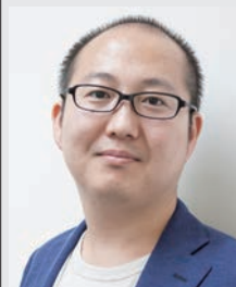
Recruit Institute of Technology 推進室 室長