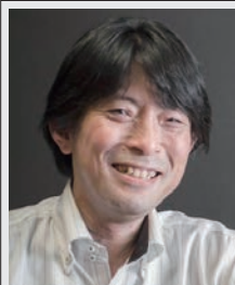
電気通信大学・ 人工知能先端研究センター センター長