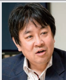
国立情報学研究所 教授 人工知能学会 会長