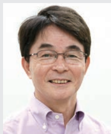
情報通信研究機構 脳情報通信融合研究センター センター長