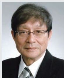
産業技術総合研究所 人工知能研究センター センター長