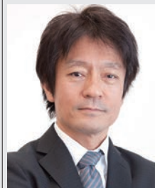
ドワンゴ人工知能研究所 所長